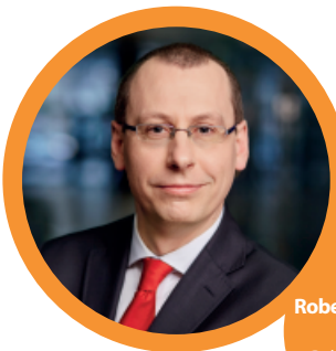
Robert Andrzejczyk Prezes Polskiej Organizacji Turystycznej

Popularność akcji wśród partnerów rośnie dynamicznie. Zauważają oni, że wspólnie mogą zyskać więcej niż w pojedynkę. Co najważniejsze, ta akcja ma na celu także zmianę turystycznych przyzwyczajeń Polaków. Zależy nam jak i branży, żeby rodacy podróżowali także poza sezonem wysokim. Wszystkim 757 partnerom piątej edycji bardzo dziękuję za udział i już teraz zachęcam kolejnych przedsiębiorców do uczestnictwa w marcowej odsłonie inicjatywy. Razem możemy naprawdę więcej.