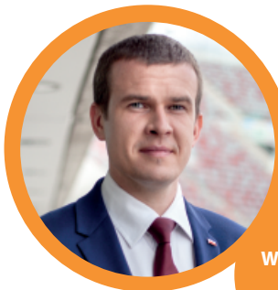
Witold Bańka Minister Sportu i Turystyki

„POLSKA ZOBACZ WIĘCEJ – WEEKEND ZA PÓŁ CENY” cieszy się coraz większą popularnością. Przed rozpoczęciem piątej edycji mówiliśmy o wzroście liczby partnerów. Po jej zakończeniu po raz kolejny możemy pochwalić się najwyższą w historii liczbą turystów, którzy skorzystali z obniżonych o minimum 50 proc. cen. Jesienią było to aż 165 tys. osób. W przyszłym roku jesienna edycja promowana będzie także za granicą.